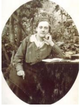
Pensionaat St. Calvaire